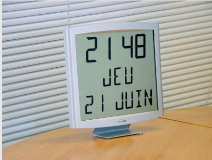
Cristalys date sur support de table