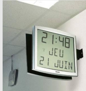
Cristalys date sur support double face